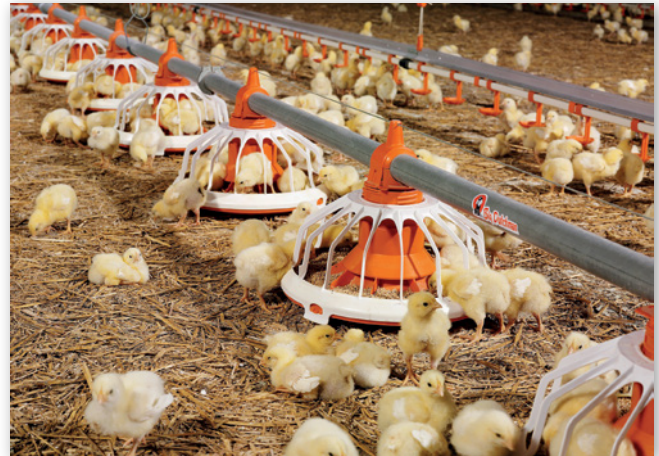
Abbildungen 16 und 17: Nippeltränke mit Auffangschale (links) und Futterpfannen (rechts)

Bei der Futtervorlage kommen Rohranlagen mit Pfropfen- und Schneckenförderung zum Einsatz, die das Futter aus dem Vorratssilo in Töpfe mit hohen und niedrigen Rändern unterschiedlichster Detailkonstruktionen fördern. Tränk- und Futtereinrichtungen sind immer an die Größe der Tiere anzupassen und so einzustellen, dass die Tiere während der gesamten Mastperiode leicht an Futter und Wasser gelangen, aber ein Futterverlust vermieden wird. Unter praktischen Gesichtspunkten bedeutet das, dass sich die Fütterungseinrichtungen in etwa auf Rückenhöhe der Tiere befinden sollten. Die Nippelhöhe der Tränken sollte so eingestellt sein, dass die Tiere diese gut erreichen können, sich jedoch zur Erlangung von Wasser etwas strecken müssen. So wird sichergestellt, dass die Tiere nicht mit den Nippeln spielen und so Wasser unnötig in die Einstreu läuft. Unter üblichen Temperaturbedingungen für