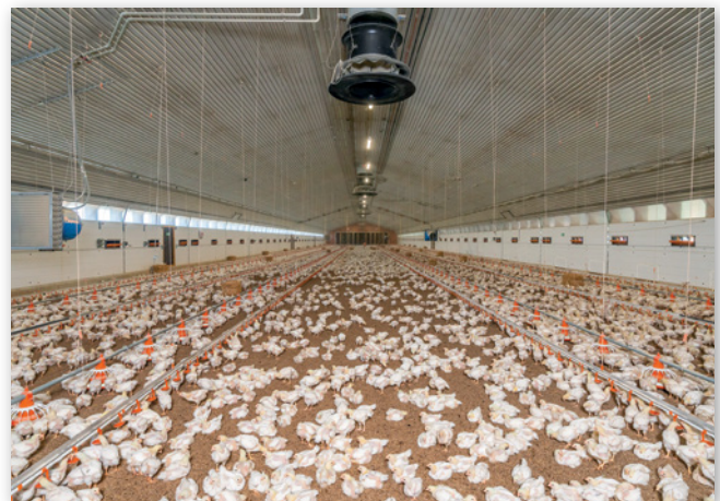
Abbildungen 3 und 4: Masthühner zu Beginn (links) und am Ende (rechts) der Mastperiode