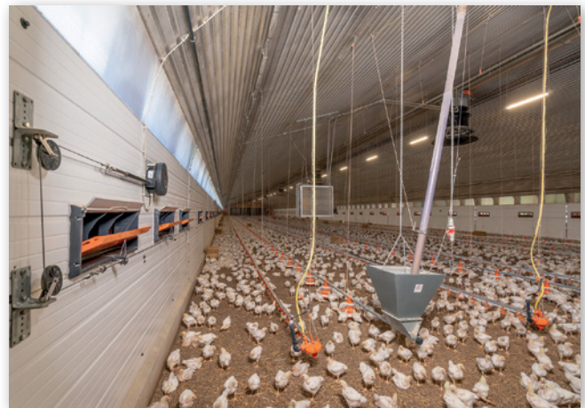
Abbildungen 12 und 13: Deckenzuluft- (links) und Seitenzuluft-Ventile (rechts)

Besonders bei hohen Außentemperaturen im Sommer ist eine ausreichende Lüftung wichtig, um den Wärmeüberschuss aus dem Tierbereich gleichmäßig abzuführen. Hierfür kommen Lüftungssysteme zum Einsatz, die den sogenannten „Windchill Effekt“ nutzen, also eine Abkühlung durch erhöhte Luftgeschwindigkeit am Tier bewirken. Hierzu wird die Luftströmung vorwiegend in Längsrichtung überführt, also Zuluft vorwiegend an einer Giebelseite, ggf. mit unterstützender „Wasserriesel-Pad“ Kühlung, und Abluft entsprechend am gegenüber liegenden Ende. Dieses Ventilationsprinzip ist als sogenannte Tunnelventilation bekannt. Für die hiesigen Klimazonen wird dieses Lüftungssystem durch geeignete Zuluftventile in der Seitenwand zur Frischluftversorgung bei niedrigen Außentemperaturen im Winter ergänzt, wobei dann von einer sogenannten „Combi-Tunnelventilation“ gesprochen wird. Eventuell müssen noch weitergehende Maßnahmen (Dachberegnung, Einsatz von Sprühnebelanlagen