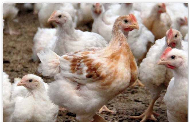
Abbildung 9: Langsam wachsendes Masthuhn Hubbard JA 787

Neben den konventionellen Intensivmastverfahren existieren konventionelle, extensive Mastverfahren nach VO (EWG) Nr. 1538/91 Anhang 4 und die Biohähnchenmast nach VO (EG) Nr. 834/2007. Diese Verfahren zeichnen sich vor allem dadurch aus, dass hier u. a. langsam wachsende Tiergenetiken, eine geringere Besatzdichte, der Zugang zu einem Auslauf und eine deutliche längere Mastdauer vorgeschrieben werden. Die Vorgaben für die Biohähnchenmast gehen hierbei noch über die für die konventionelle Extensivmast hinaus.