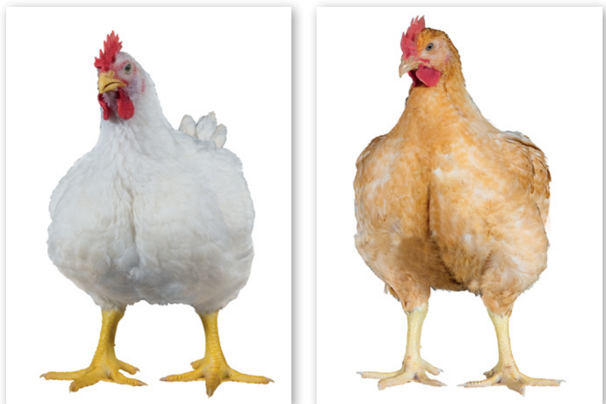
Abbildungen 1 und 2: Masthybrid Ross 308 (schnell wachsend) und Ranger Gold (langsam wachsend)

Für die Erreichung des angestrebten genetischen Zuchtfortschrittes muss der Züchter auf ausgewogene und objektiv messbare Selektionskriterien achten, die die vorhandenen negativen Beziehungen, z.B. zwischen der Reproduktionsleistung (Kükenzahl) und Mastleistung (Gewichtszunahme, Fleischansatz), einbeziehen. Bei einseitiger Betonung eines Merkmalskomplexes kann leicht die Wirtschaftlichkeit auf einer der Erzeugungsstufen oder bei einer integrierten Erzeugung die Gesamtwirtschaftlichkeit leiden. Seit 2002 werden neben reinen Leistungsmerkmalen auch Tierwohl-Kriterien und die Fitness der Tiere im Selektionsindex berücksichtigt. Sie machen derzeit rund \frac{1}{3} der Selektionsintensität aus.