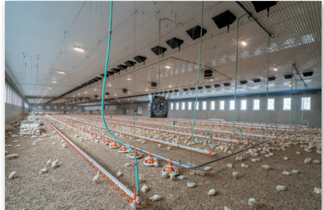
Abbildung 18: Nippeltränken mit endständigem Ablauf zur automatisierten Spülung

Die nach TierSchNutzTV erforderlichen Tränke- und Futterflächen je Tier sind in der folgenden Tabelle zusammengestellt.