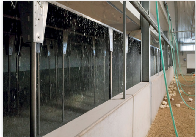
Abbildungen 14 und 15: Abluftwäscher an der Stirnseite des Stalles (links) und in Funktion (rechts)

Bei Stallneubauten werden für die zu erteilende Genehmigung immer häufiger Abluftreinigungssysteme gefordert. Nachdem die Staubfracht aus Geflügelställen eine besondere Herausforderung darstellt, galten Abluftreinigungssysteme für Geflügelställe lange Zeit als nicht Stand der Technik. Inzwischen sind aber 1- bis 2-stufige Chemo-Wäscher erhältlich, die bereits überwiegend von der DLG geprüft wurden. Die Wäscher reduzieren Staub und Ammoniak effektiv, während die Geruchsminde- rung bisher nur eingeschränkt möglich ist.