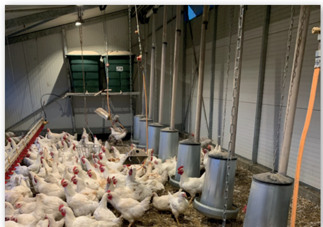
Abbildungen 5 und 6: Mobilställe für die Hühnermast von Steiner (links) und Würdekemper (rechts)