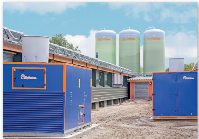
Abbildungen 10 und 11: Warmwasserheizungsregister (links) und Wärmetauscher außen (rechts)