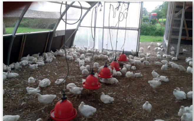
Abbildungen 7 und 8: Konventionelle Freilandhaltung (links) und ökologische Haltung von Masthühnern (rechts)

Neben den konventionellen Intensivmastverfahren existieren konventionelle, extensive Mastverfahren nach VO (EWG) Nr. 1538/91 Anhang 4 und die Biohähnchenmast nach VO (EG) Nr. 834/2007. Diese Verfahren zeichnen sich vor allem dadurch aus, dass hier u. a. langsam wachsende Tiergenetiken, eine geringere Besatzdichte, der Zugang zu einem Auslauf und eine deutliche längere Mastdauer vorgeschrieben werden. Die Vorgaben für die Biohähnchenmast gehen hierbei noch über die für die konventionelle Extensivmast hinaus.