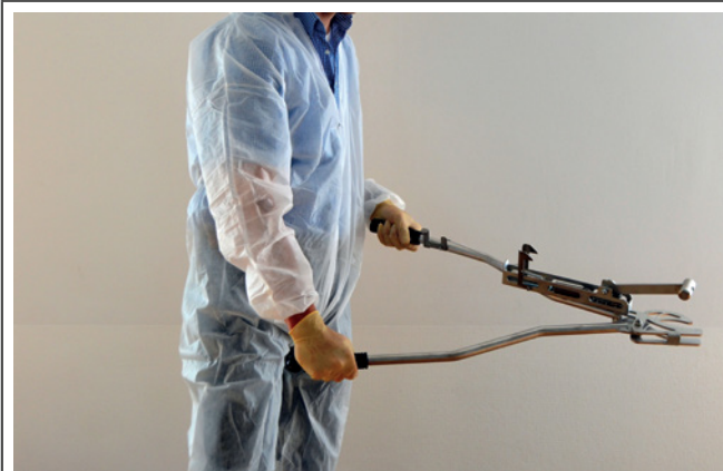
7. Der Schlagarm trifft mit voller Wucht auf den Kopf des Tieres.