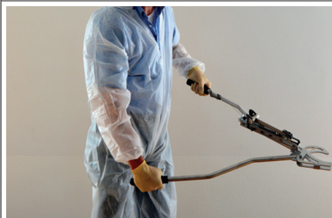
5. Das Tier unterhalb des Kopfes mit den Zangenbacken fixieren.