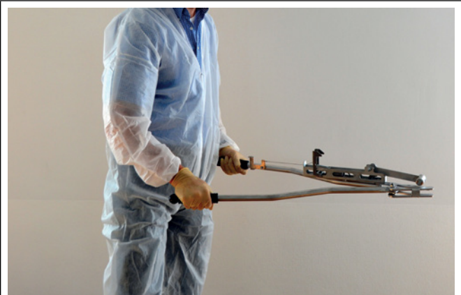
8. Die Zangenbacken mit maximaler Kraft bis zum Anschlag zusammendrücken.