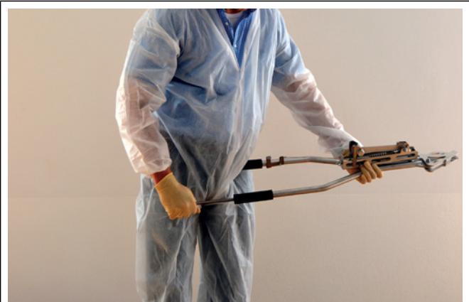
4. Den Spanner in den Holm zurückstecken.