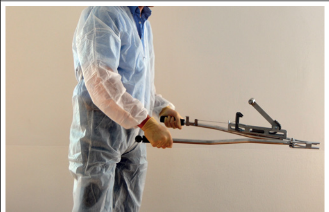
6. Den Schlagarm mit dem linken Daumen ausklinken lassen.