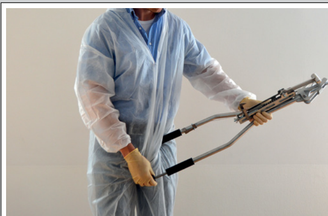
1. Zange am Körper positionieren und den Spanner aus dem Holm ziehen.

Die FBT-Zange vereint drei Schritte, die für das Töten von erkrankten und nicht behandelbaren Tieren (Puten, Gänsen, Enten, Hühnern etc.) notwendig sind. Mit der Zange sind das Tier und der für die Betäubung ausgewählte Kopf so fixiert, dass der gezielte Betäubungsschlag erfolgen kann. Das Fixieren des Kopfes mit den Zangenbacken und der Federspannmechanismus sorgen dafür, dass der Kopf an der richtigen Stelle und mit der ausreichenden Schlagkraft getroffen wird. Die Länge der Zangenarme ermöglicht beim anschließenden Zusammendrücken auch Personen mit nicht ganz so kräftigen Armen eine sichere Trennung von Kopf und Halswirbelsäule des Tieres. Das Rückenmark wird dabei zerstört (zervikale Dislokation) und es kommt in aller Regel auch zu einem Zerreißen der Blutgefäße mit starken Blutungen unterhalb der Haut. Das Rückenmark ist durchtrennt und die Blutversorgung zum Kopf (Gehirn) ist unterbrochen. Der Tod tritt unmittelbar ein.