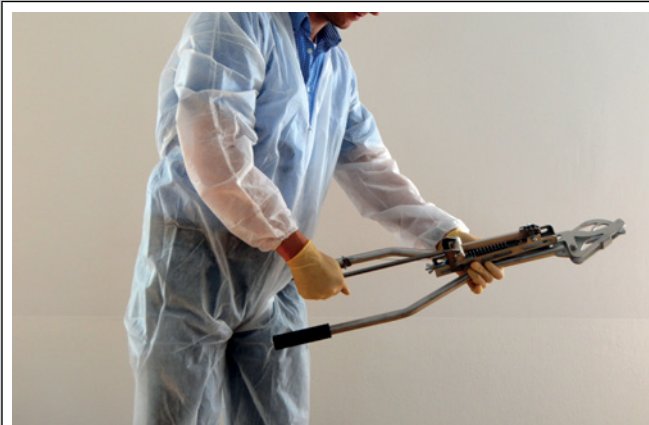
3. Den Schlagarm in die Haltung einrasten lassen.