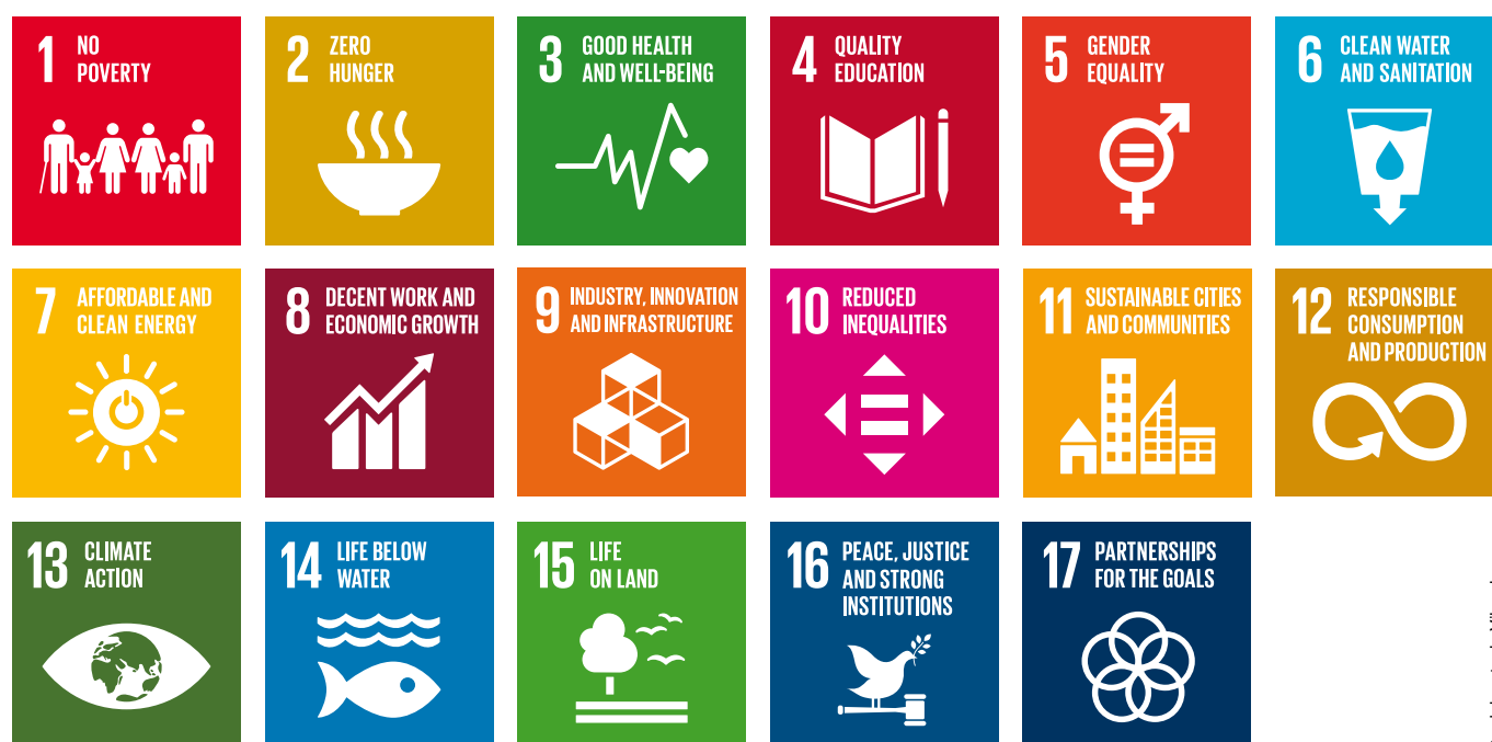
Abbildung 2: Die 17 Sustainable Development Goals (SDGs) sind politische Zielsetzungen der Vereinten Nationen, die weltweit der Sicherung einer nachhaltigen Entwicklung auf ökonomischer, sozialer und ökologischer Ebene dienen sollen.

Die 17 SDGs (siehe Abbildung 2) sind politische Zielsetzungen der Vereinten Nationen, die weltweit der Sicherung einer nachhaltigen Entwicklung auf ökonomischer, sozialer und ökologischer Ebene dienen sollen. Lebensmittelverpackungen mit effektivem Produktschutz und effizientem Materialeinsatz haben das Potenzial, zur Erreichung der SDGs beizutragen.