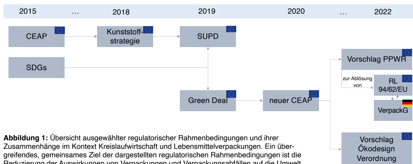
Abbildung 1: Übersicht ausgewählter regulatorischer Rahmenbedingungen und ihrer Zusammenhänge im Kontext Kreislaufwirtschaft und Lebensmittelverpackungen. Ein übergreifendes, gemeinsames Ziel der dargestellten regulatorischen Rahmenbedingungen ist die Reduzierung der Auswirkungen von Verpackungen und Verpackungsabfällen auf die Umwelt.

Im Kontext Lebensmittelverpackungen und Kreislaufwirtschaft sind u. a. die in Abbildung 1 dargestellten regulatorischen Rahmenbedingungen relevant. Diese werden in den nachfolgenden Kapiteln 3.1 bis 3.6 näher betrachtet.